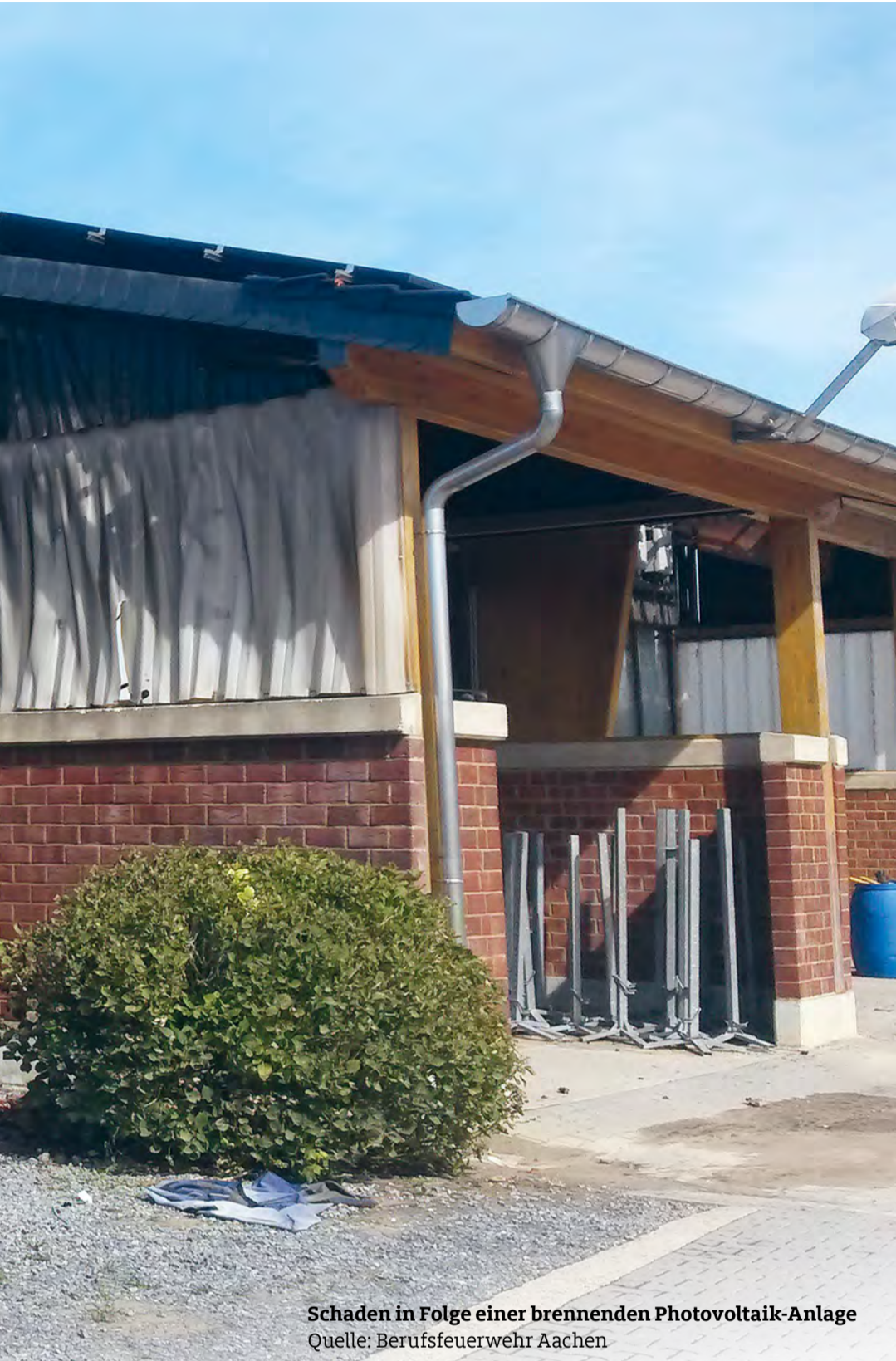
Schaden in Folge einer brennenden Photovoltaik-Anlage