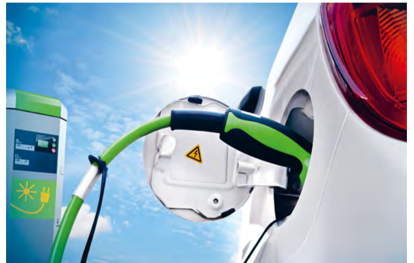
Sauber: Eingespartes CO 2 bringt extra Geld!

Umwelt und Haushaltskasse schonen: Wer ein E-Auto fährt, spart CO 2 und kann zudem finanziell vom Handel mit der Treibhausgas-Prämie (THG-Prämie) profitieren.